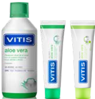
Sabor menta o manzana-menta